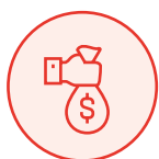
PROGRAMA DE BECAS

POR ELLO, DISPONEMOS DE UN COMPLETO SISTEMA DE AYUDAS ECONÓMICAS: